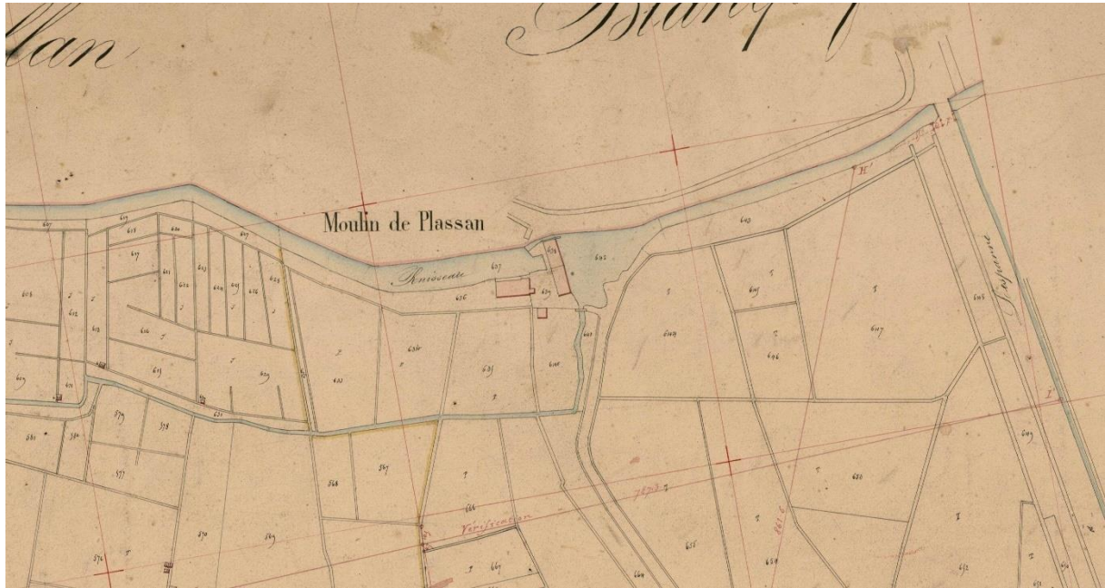
Extrait du plan cadastral de 1844 montrant l'évolution du bâti (AD33, 3P 056-62)