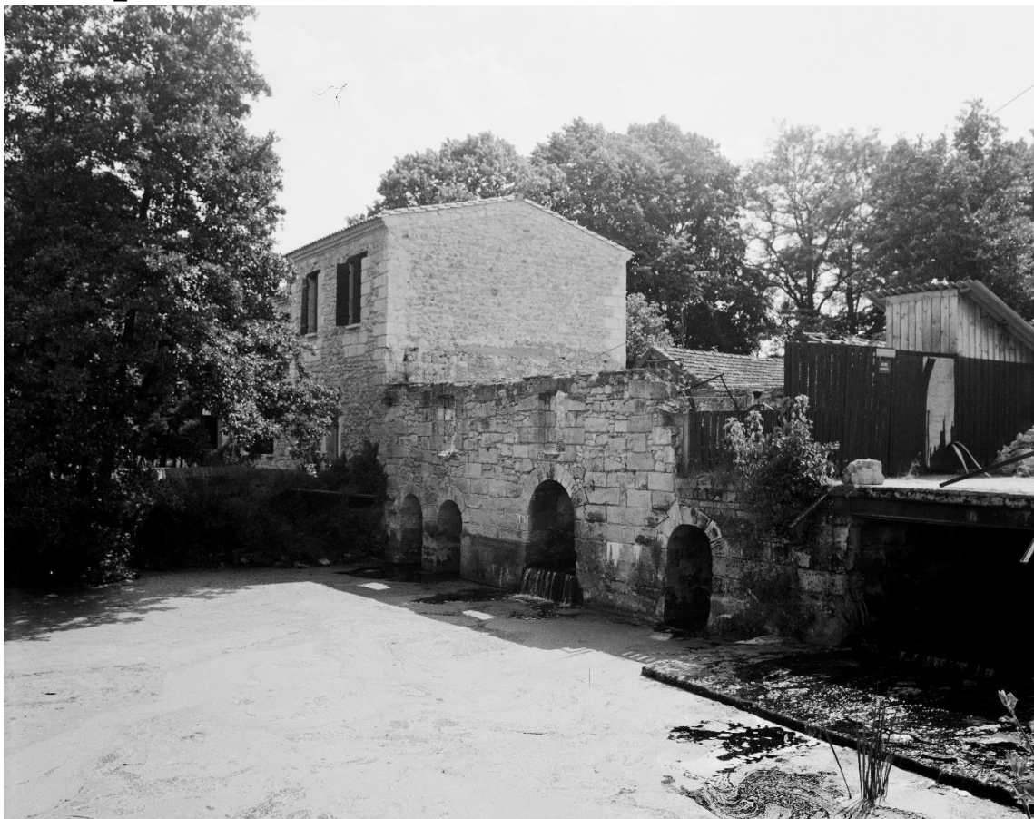
Le moulin photographié en 1976