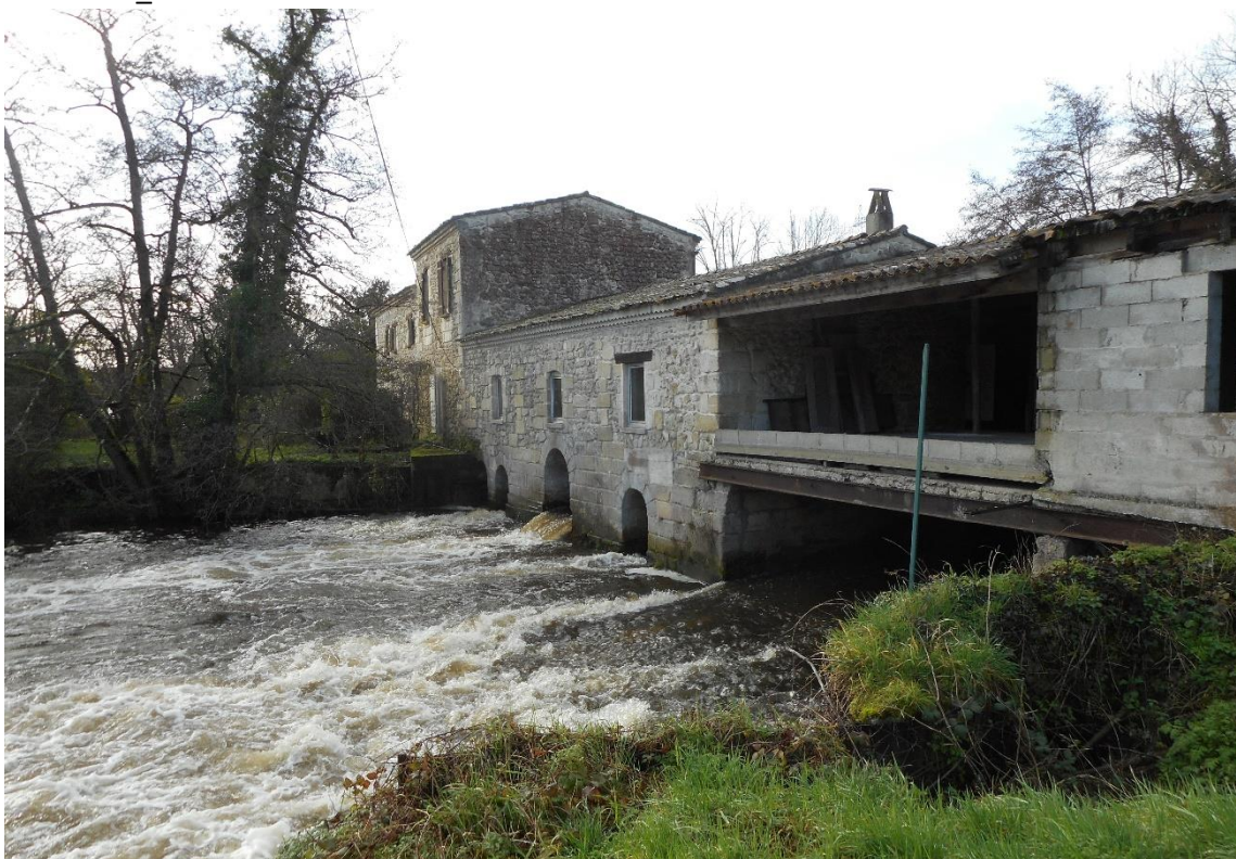
Le moulin photographié durant la crue de l'hiver 2018