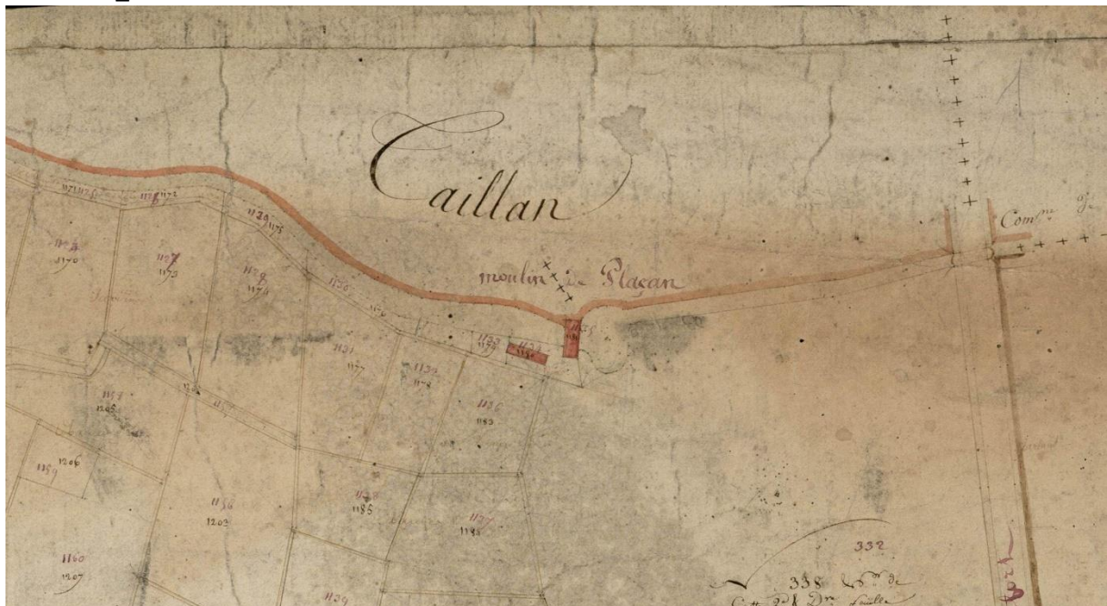
Extrait du plan cadastral de 1811 (AD33, 3P 056-27)