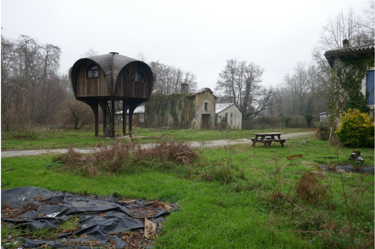
Vue d'ensemble du site, avec le refuge périurbain « Le Haut-Perché », le moulin et sa dépendance et l'habitation, 2023