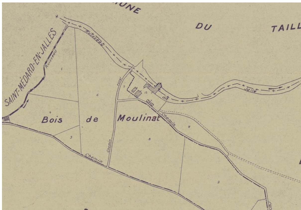
Extrait du plan cadastral rénové du Haillan, 1936 (AD33, 5754 W 3343)