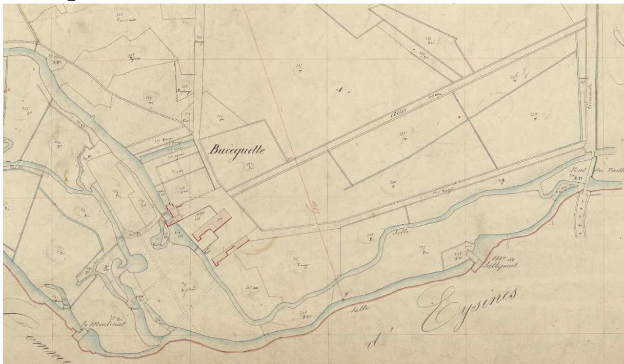
Extrait du plan cadastral du Taillan-Médoc, avec la présence des moulins de Bussaguet, Moulinat et Jallepont, 1844 (AD33, 3P 519-11)