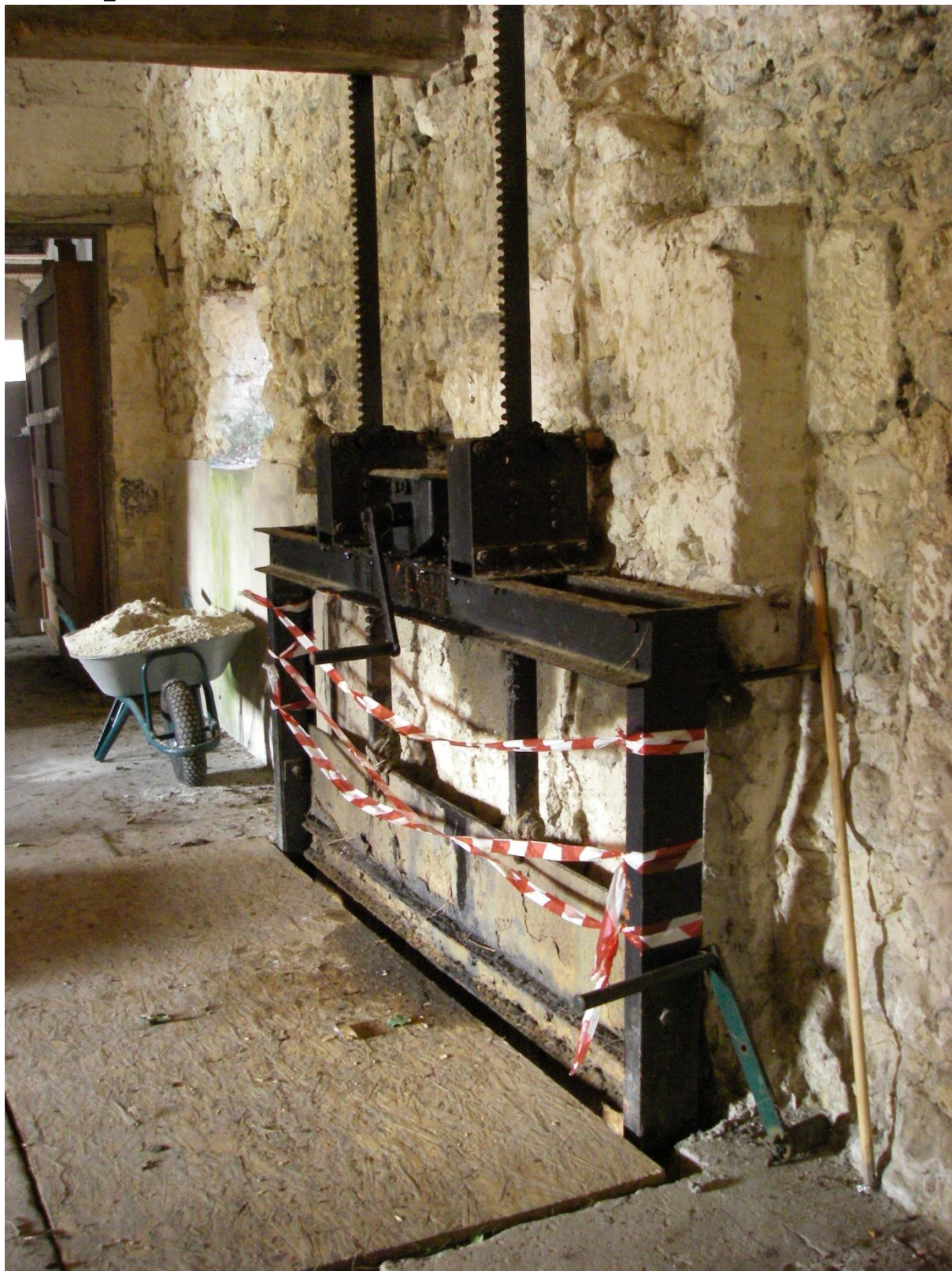
Vanne motrice de la roue horizontale du moulin, 2013