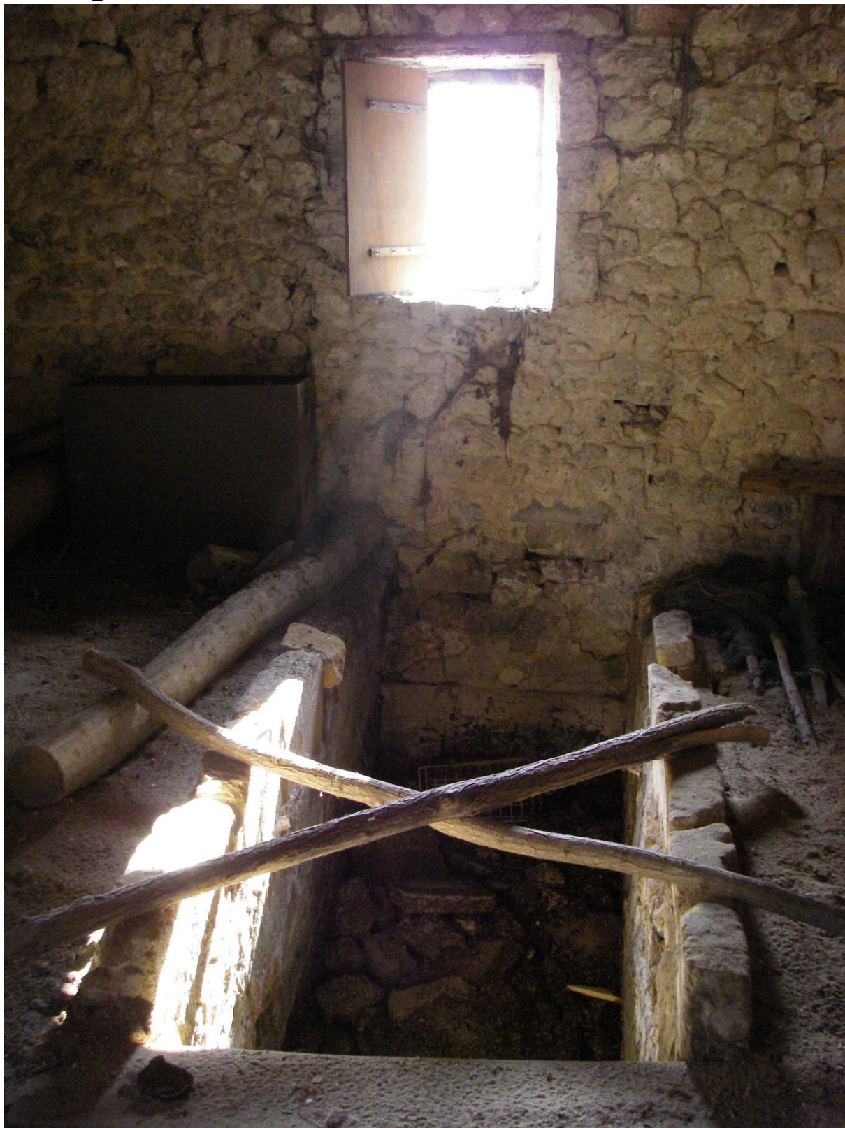
Emplacement de la roue verticale par en-dessous (disparue), 2013