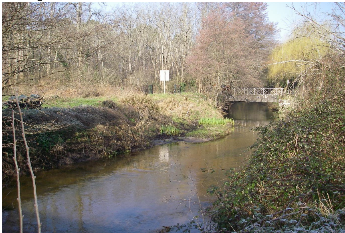
Le pont franchissant le bras sud de la jalle à l'amont du moulin, 2013