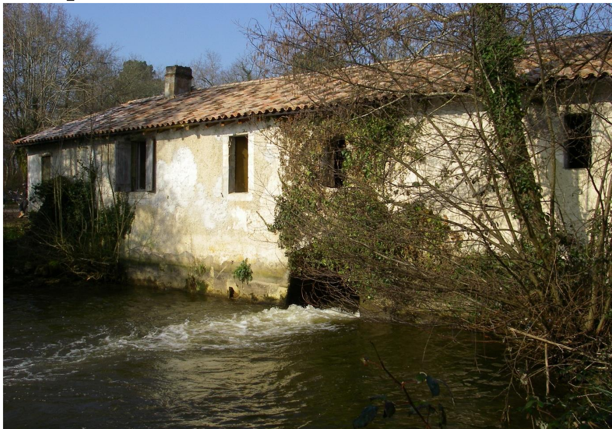
Le moulin, vue de l'aval en 2013