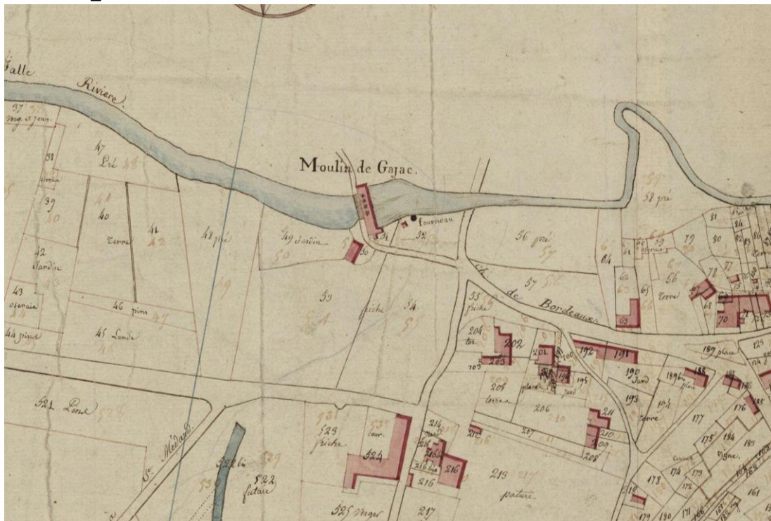
Extrait du plan cadastral de 1808 montrant la situation de Gajac, ses quatre meules et son haut fourneau (AD33, 3P 449-39)