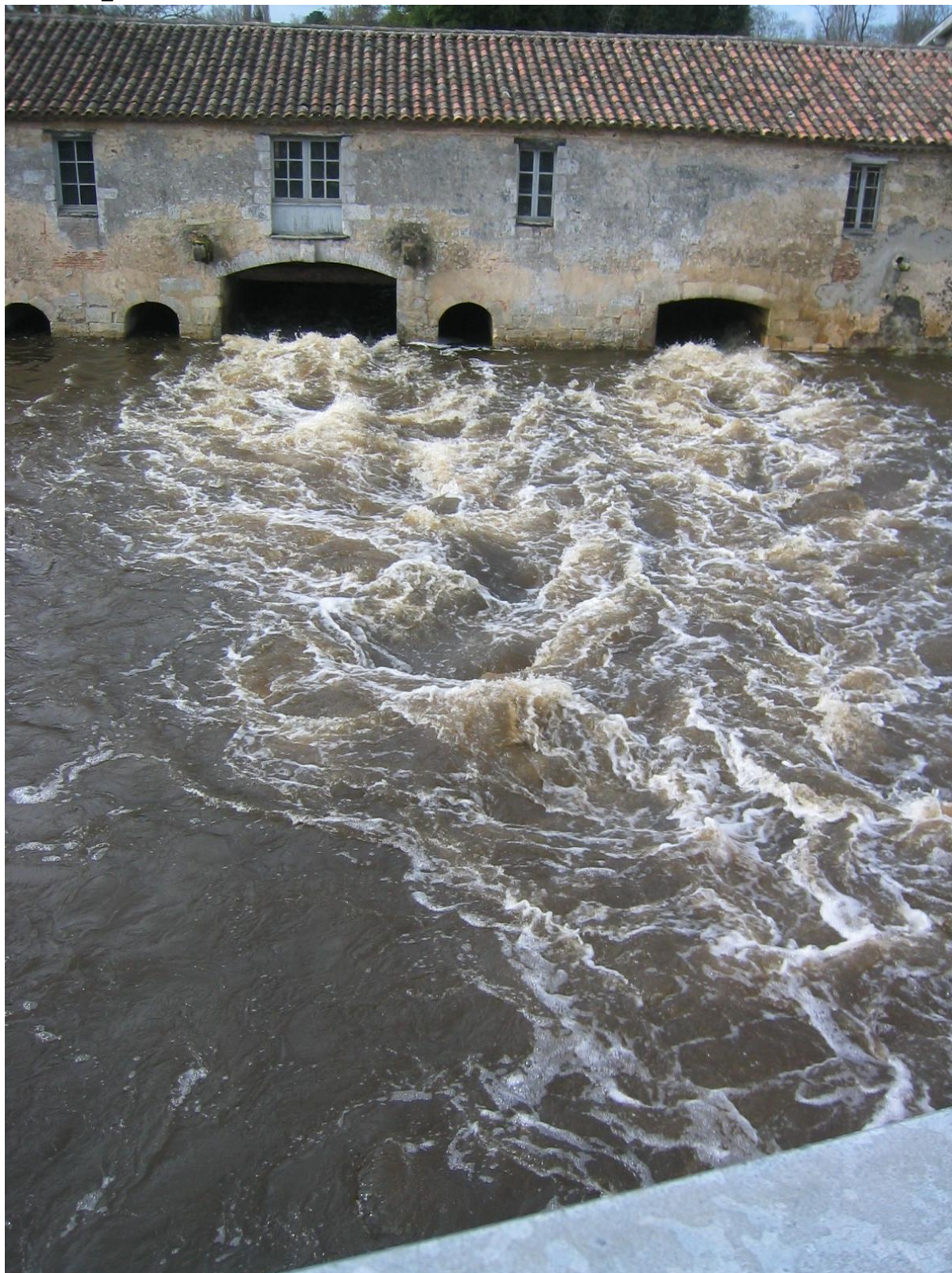
Crue de la jalle au moulin de Gajac en mars 2006