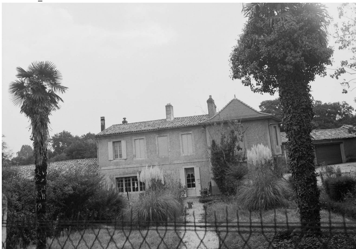
Vue de la maison d'habitation de puis l'ouest en 1977