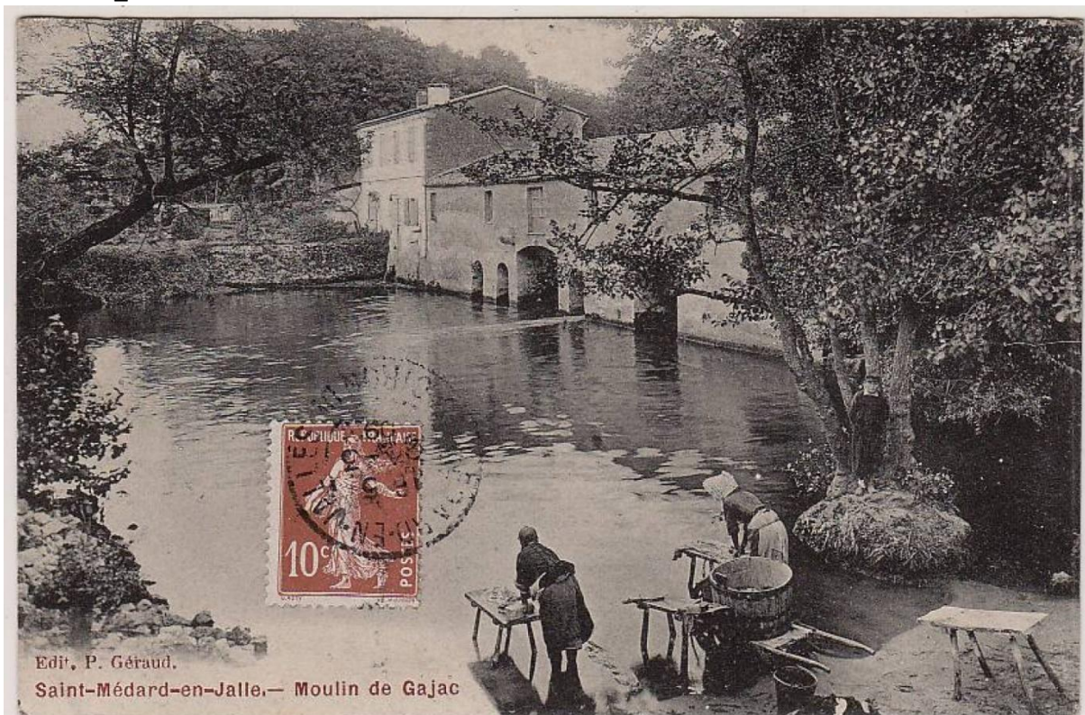
Le moulin de Gajac vu depuis l'aval avec des lavandières, carte postale vers 1900