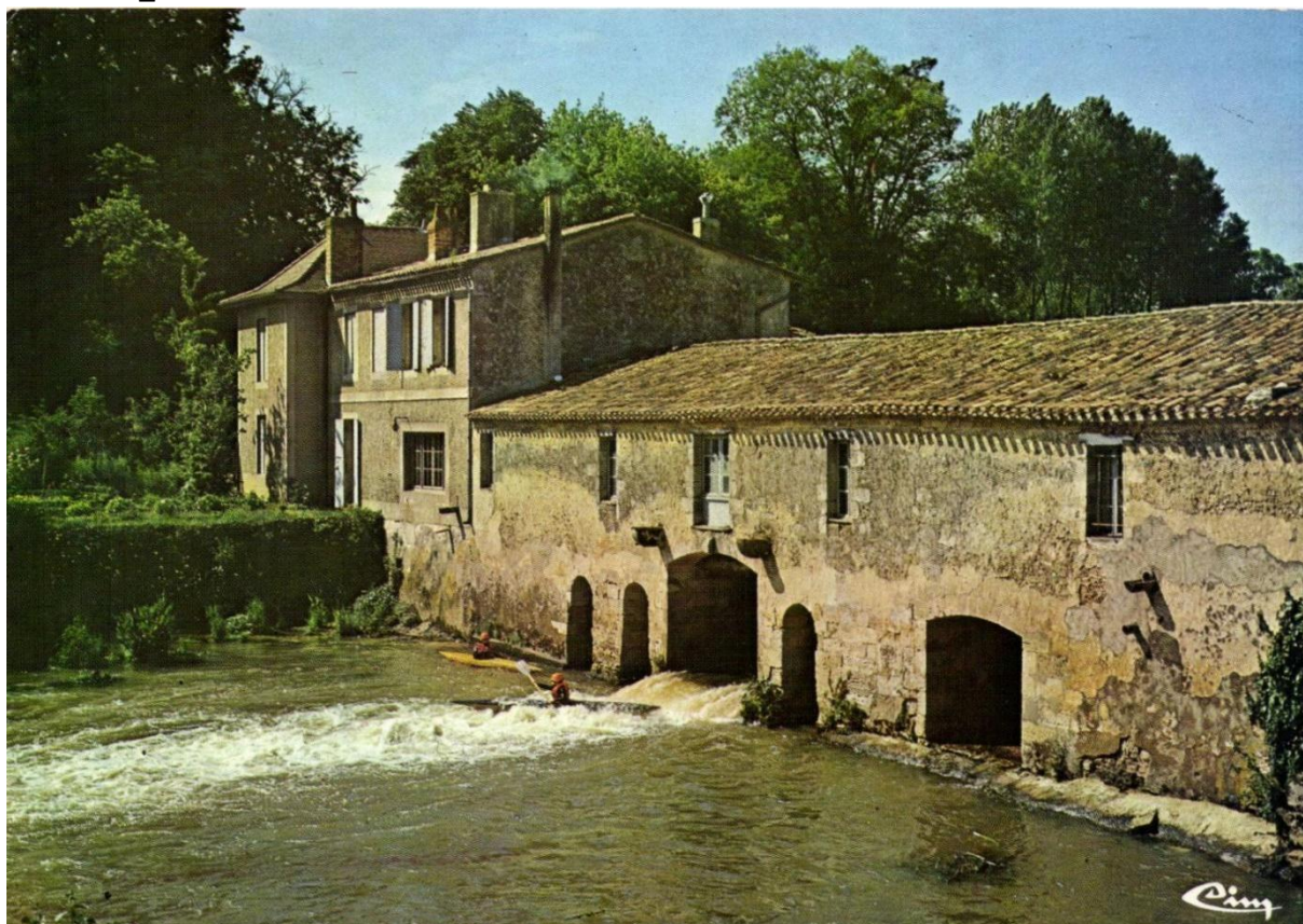
Des kayakistes dans les remous du moulin de Gajac, carte postale vers 1960