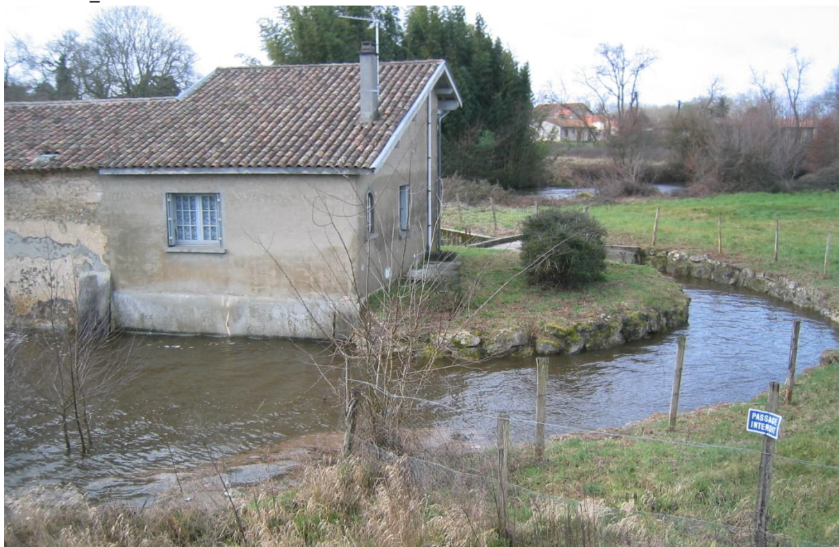
Vue du bras de décharge passant au nord des bâtiments lors de la crue de mars 2006