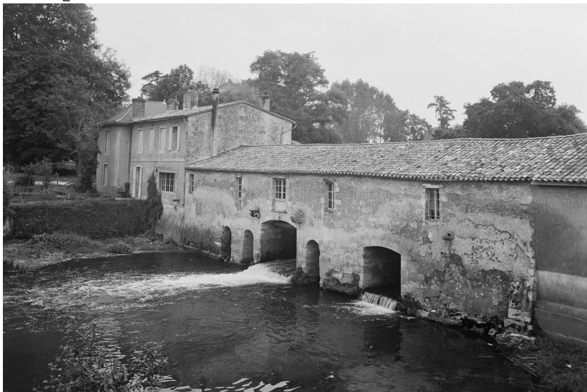
Vue des bâtiments du moulin depuis l'aval en 1977