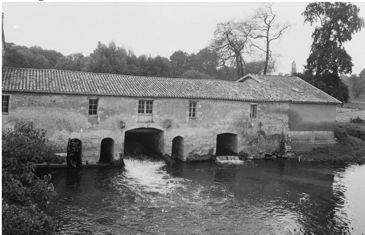
Vue du bâtiment du moulin depuis l'aval en 1977