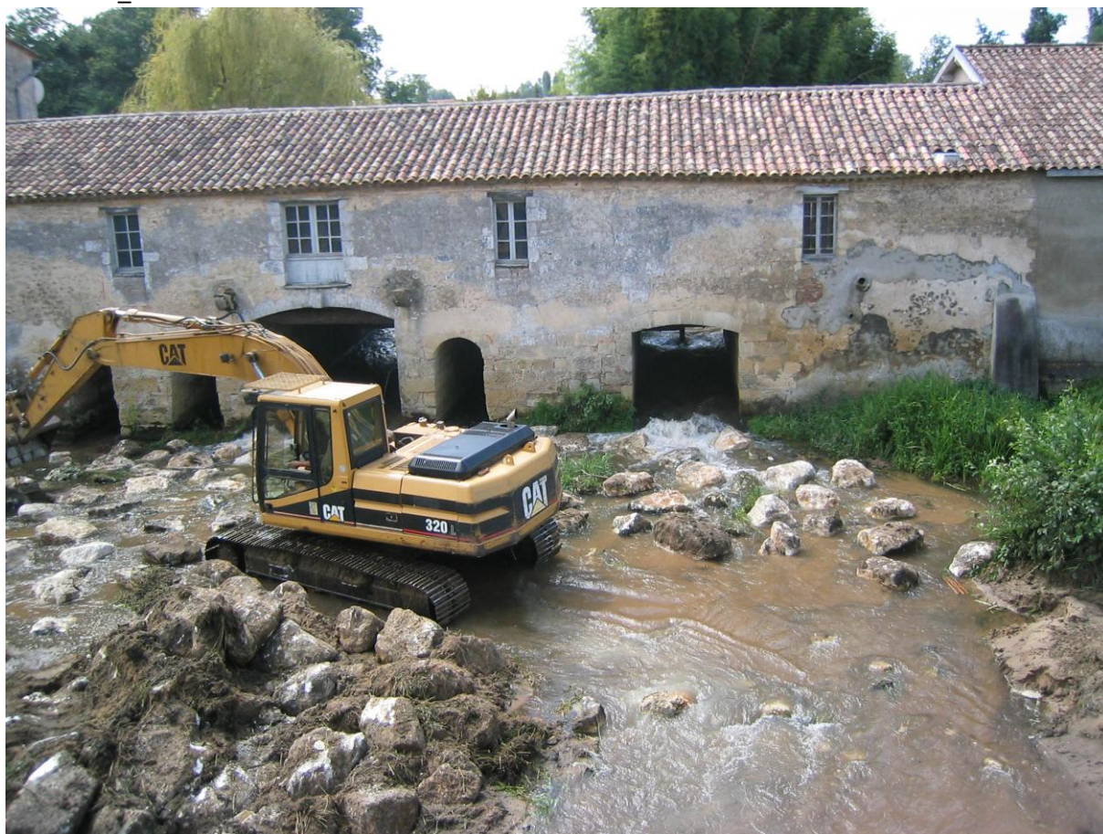
Travaux en rivière au moulin de Gajac en mai 2008