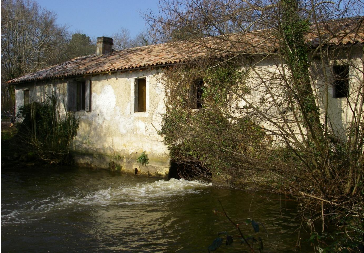
Le moulin, vue de l'aval en 2013