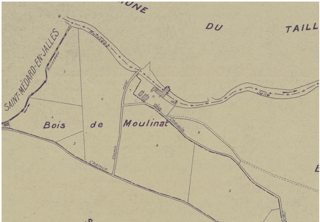
Extrait du plan cadastral rénové du Haillan, 1936 (AD33, 5754 W 3343)