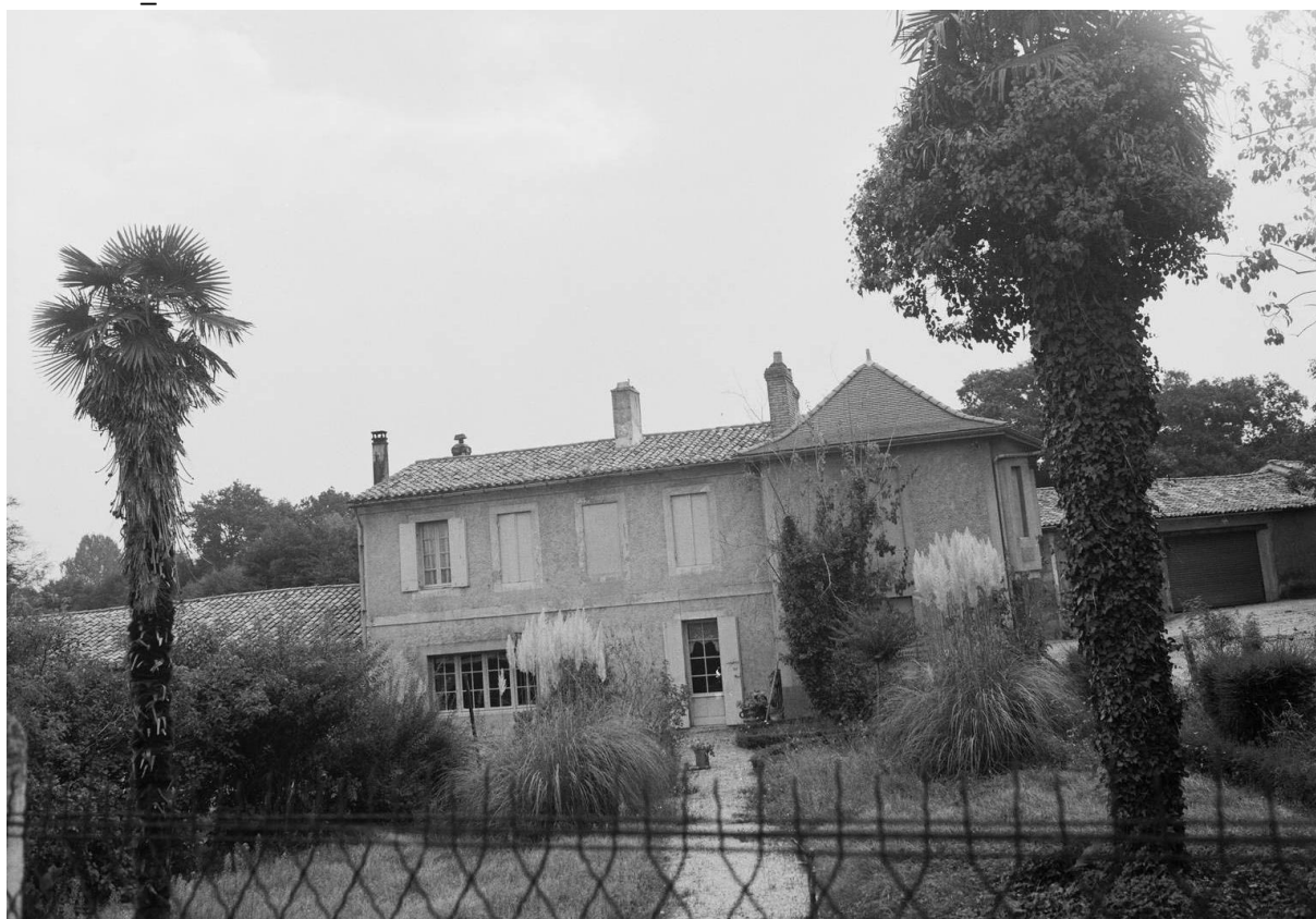
Vue de la maison d'habitation depuis l'ouest en 1977