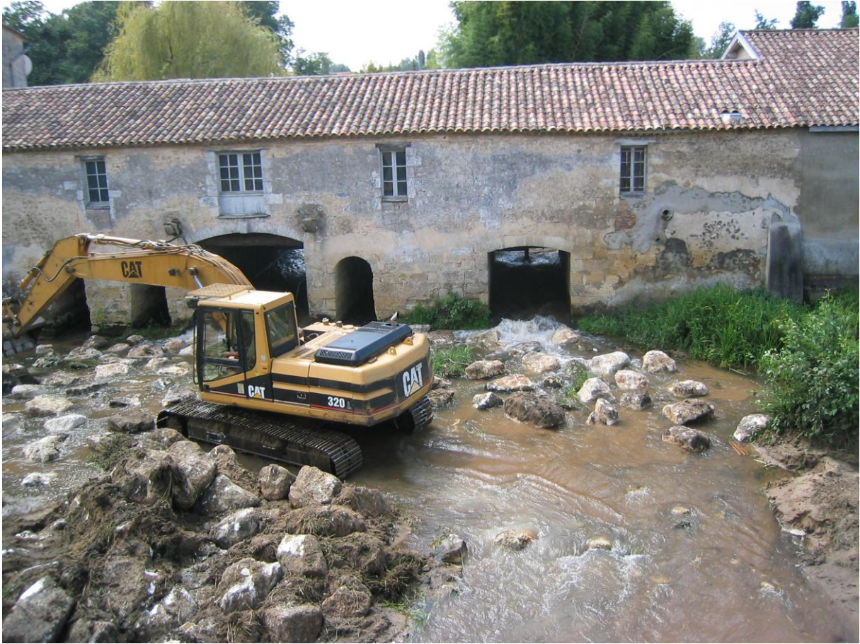
Travaux en rivière au moulin de Gajac en mai 2008 (cl. Fabrice Demarty)