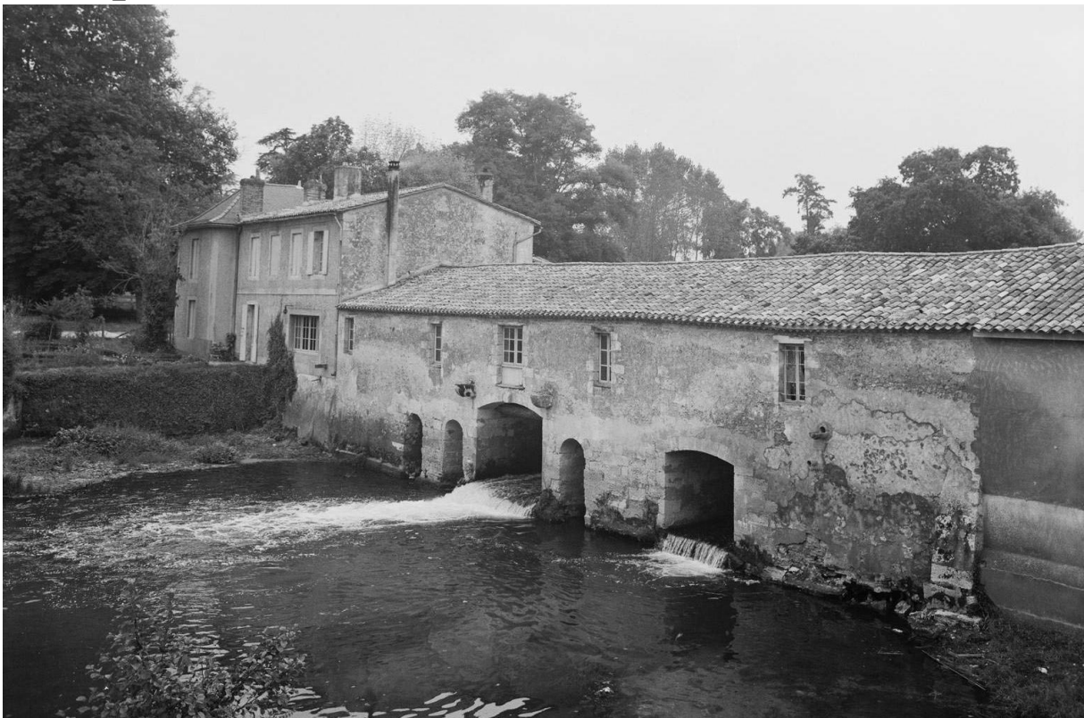
Vue des bâtiments du moulin depuis l'aval en 1977