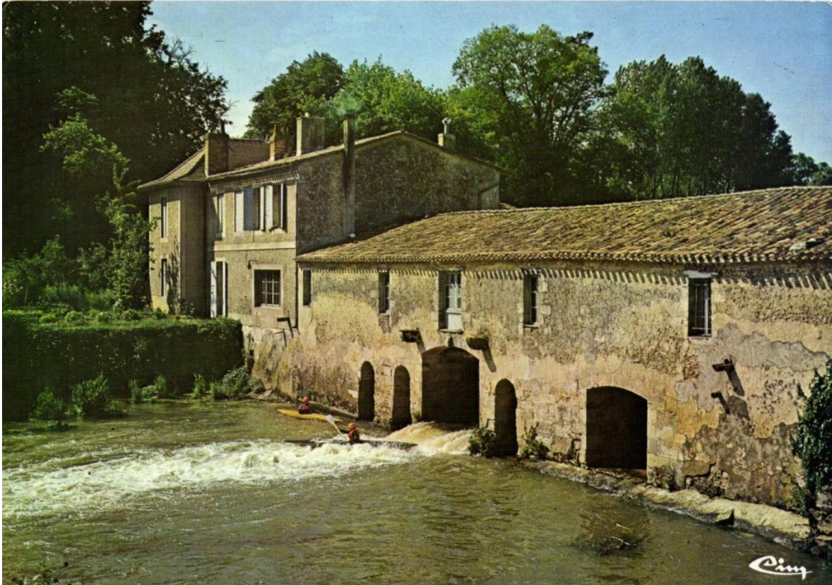
Des kayakistes dans les remous du moulin de Gajac, carte postale vers 1960