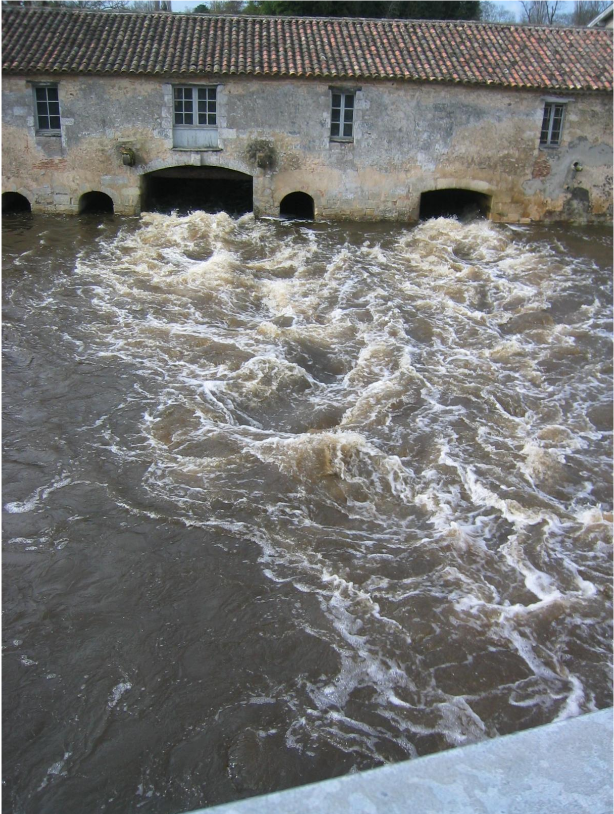
Crue de la jalle au moulin de Gajac en mars 2006