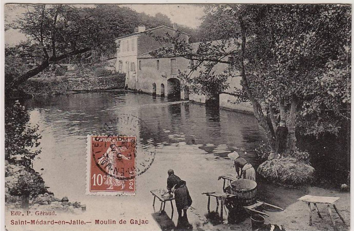
Le moulin de Gajac vu depuis l'aval avec des lavandières, carte postale vers 1900 (collection particulière)