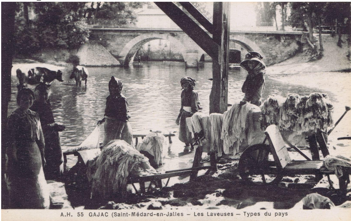
L'activité lavandière au lavoir à l'aval du moulin et du pont de Gajac, carte postale vers 1900